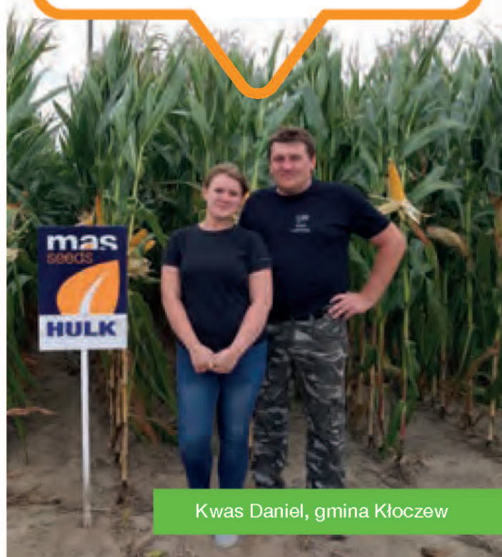
Kwas Daniel, gmina Kłoczew

Jak na załączonym obrazku gęsto ulistniona roślina, świetnie zaziarniona kolba jest cechą charakterystyczną odmiany HULK. W takim ciężkim roku, gdzie opadów było bardzo niewiele z powodzeniem można liczyć na HULK. Polecam HULK na kiszonkę i na ziarno na wszystkie stanowiska.